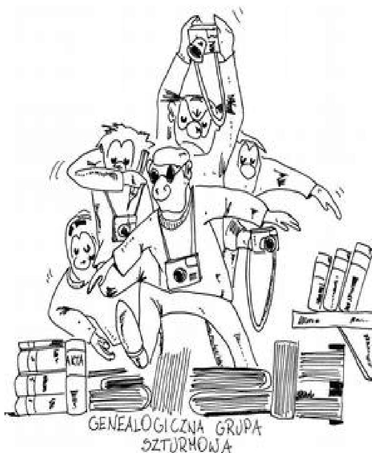
Rys. 2. Autor: Mariusz Żebrowski

Więcej prac dostępnych na stronie: www.genoroots.com/genogaleria