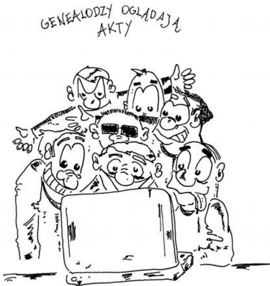
Rys. 68. Autor: Mariusz Żebrowski

Więcej prac dostępnych na stronie: www.genoroots.com/genogaleria