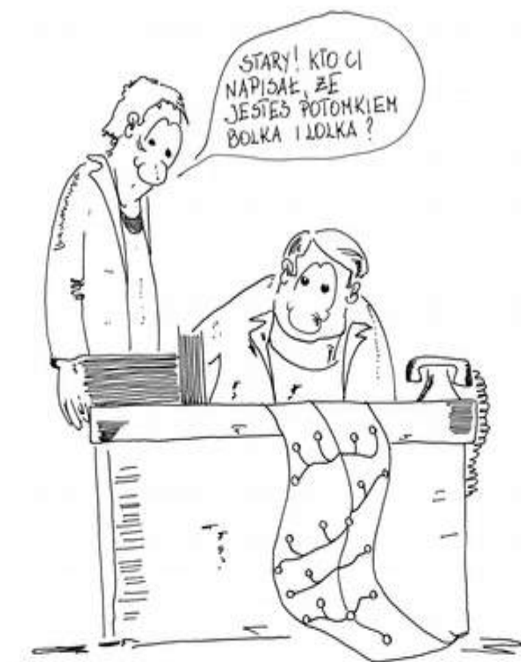
Rys. 4. Autor: Mariusz Żebrowski

Więcej prac dostępnych na stronie: www.genoroots.com/genogaleria