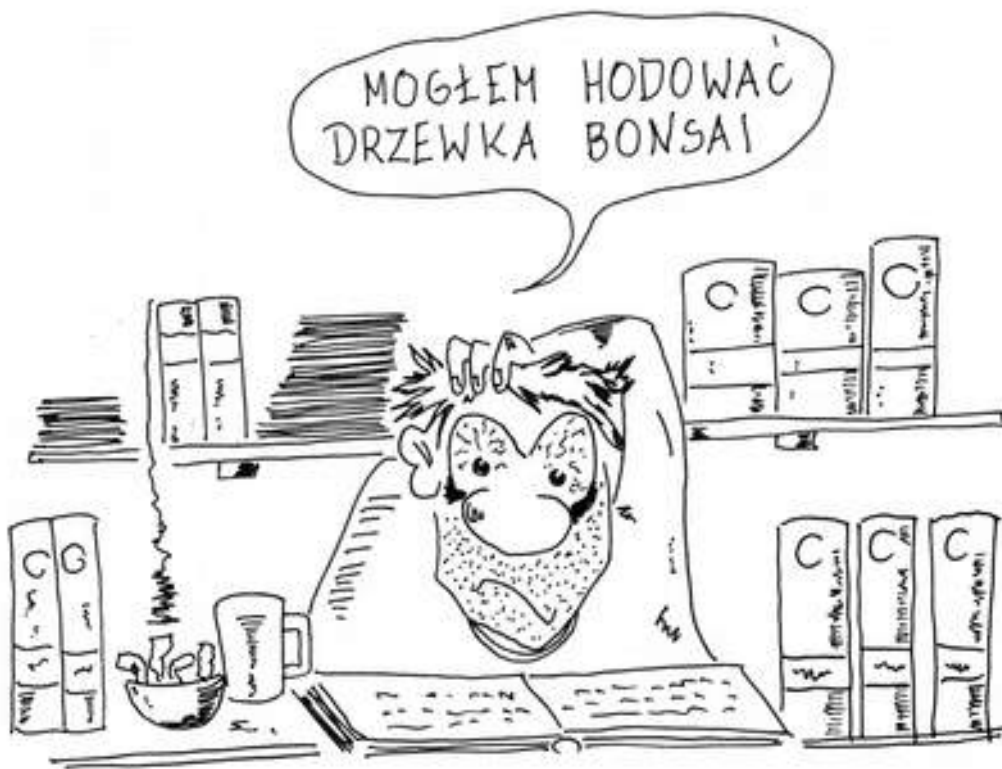
Rys. 1. Autor: Mariusz Żebrowski

Więcej prac dostępnych na stronie: www.genoroots.com/genogaleria